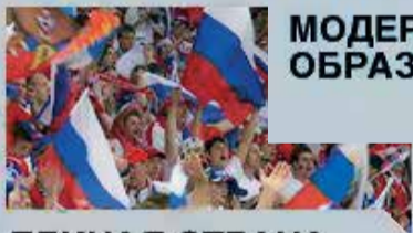
ЕДИНАЯ СТРАНА- ДОСТУПНАЯ СРЕДА