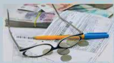
КОМИССИЯ ПО ЖКХ