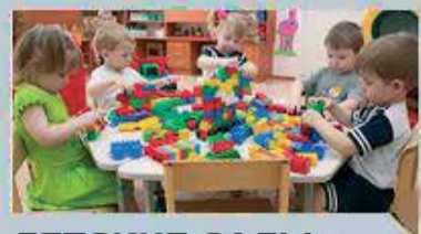
ДЕТСКИЕ САДЫ - ДЕТЯМ