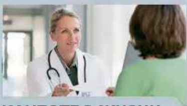
КАЧЕСТВО ЖИЗНИ (ЗДОРОВЬЕ)