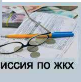
КОМИССИЯ ПО ЖКХ