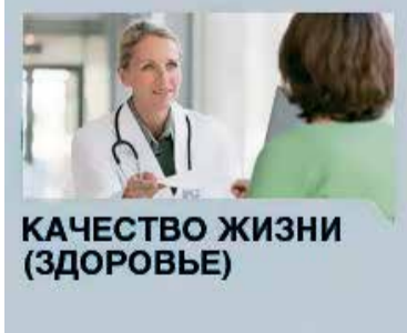
КАЧЕСТВО ЖИЗНИ (ЗДОРОВЬЕ)