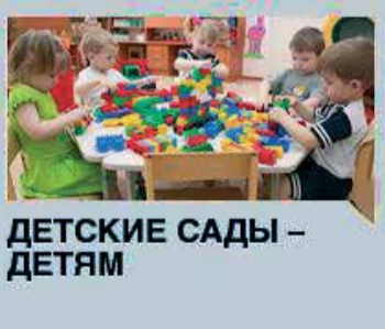
ДЕТСКИЕ САДЫ - ДЕТЯМ

Не ищите излишнюю сложность В беспокойный