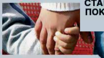
РОССИИ ВАЖЕН КАЖДЫЙ РЕБЁНОК