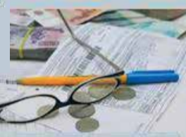
КОМИССИЯ ПО ЖКХ