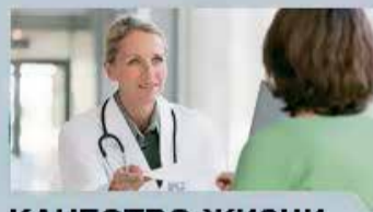
КАЧЕСТВО ЖИЗНИ (ЗДОРОВЬЕ)