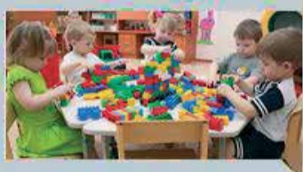
ДЕТСКИЕ САДЫ – ДЕТЯМ

«Очень важно, что у глав местного самоуправления области есть взаимодействие с региональным отделением Партии «Единая Россия», с депутатами областной Думы. Решение вопросов развития региона неотделимо от вопросов благосостояния отдельных поселений и их жителей. В Новгородской области сложился конструктивный, командный принцип работы, который позволяет совместно определять приоритеты развития в экономике и в социальной сфере...»