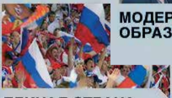
ЕДИНАЯ СТРАНА- ДОСТУПНАЯ СРЕДА