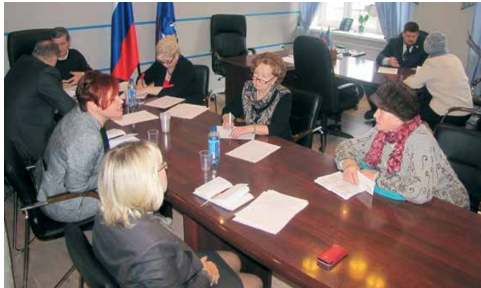
ГРАФИК приема граждан депутатами Новгородской областной Думы и депутатами Думы Великого Новгорода в РОП ПП «ЕДИНАЯ РОССИЯ» Д.А. МЕДВЕДЕВА сентябрь 2015 года

Что касается тематики обращений, наибольший процент от числа всех поступающих в приёмную просьб и жалоб составляют вопросы социального обеспечения, вопросы предоставления жилищно-коммунальных услуг, вопросы обеспечения жильём, финансово-экономические вопросы, вопросы здравоохранения.